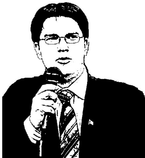
Jimmie Åkesson - partiledare för rasistiska Sverigedemokraterna