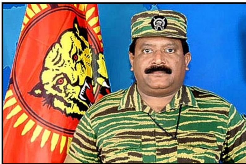
Velupillai Prabhakaran - Tamilska Tigrarnas ledare som Rajapakse vill åt.