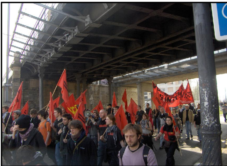
Protester mot NATO-toppmötet och mot kapitalisternas kris - i Strasbourg den 4 april.