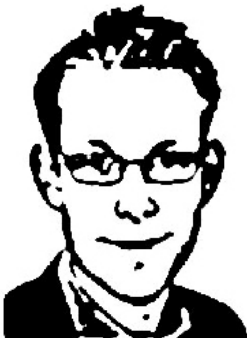
Tobias Billström - integrationsminister i Moderatregeringen