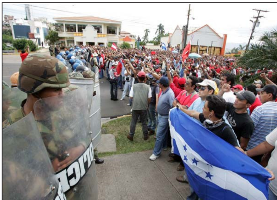
Massprotester mot militärkuppen i Honduras

En viktig del i kampen mot kuppmaakarna och deras rika uppdragsgivare är att organisera en generalstrejk. För att slutligen undanröja faran för att den honduranska eliten åter ska slå ner de fattigas strävanden är det i förlängningen nödvändigt att beröva dem deras maktbas – deras storgods, fabriker och deras feta bankkonton. Även om det just nu finns ett utrymme för samarbete även med demokrater som inte är socialister måste målet vara att arbetarklassen och de fattiga bönderna ska ta över samhällsmakten, och radikalt omfördela de rikedomar vars uppdelning är ett direkt arv från kolonialism och förtryck. Zelaya kommer knappast att gå hela den vägen. En nyckeluppgift är därför att bygga ett ledarskap som verkligen försvarar arbetarklassens intressen.