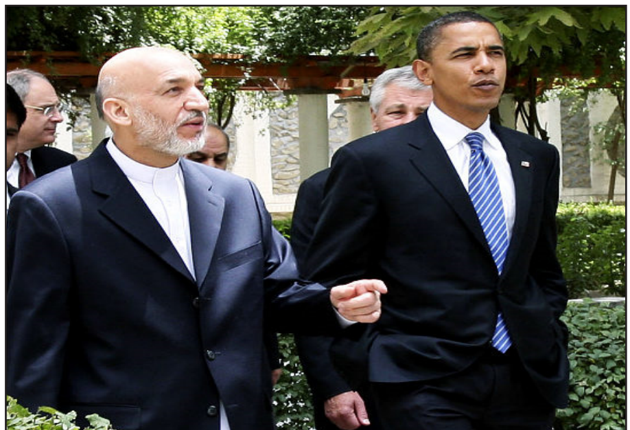
Obama och Hamid Karzai, USA:s nickedocka i Afghanistan